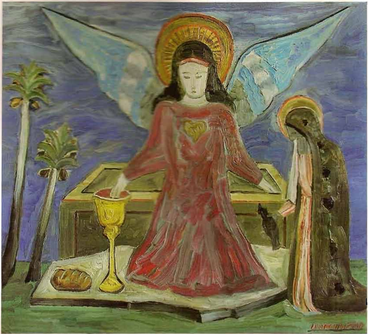
LEONARDAS GUTASUKAS. PRISIKĖLIMO RYTAS, 2002 Galerija „Rojaus kalnas“