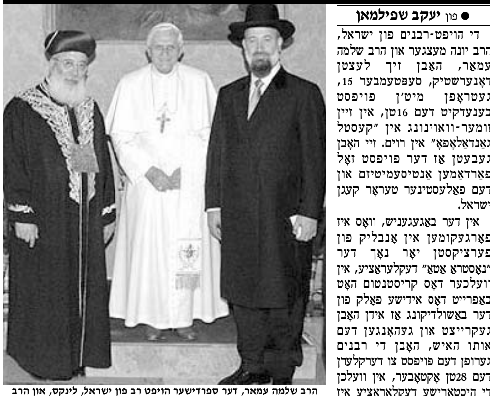
הרב שלמה עמאר, דער ספרדישער הויפט רב פון ישראל, לינקס, און הרב יונה מענצער, דער אשכנזי רב הראשי (רעכטס), בעת זייער באגעגעניש מיטן פויפסט לעצטן דאנערשטיק אין ווין