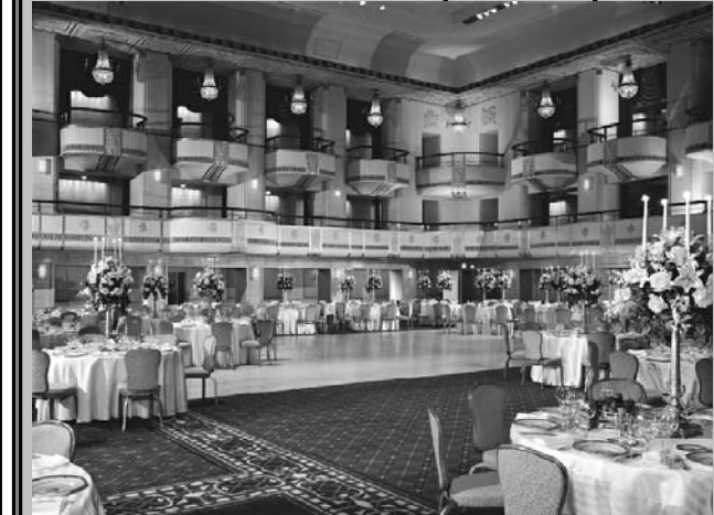
פארזעצונג אויף זייט זעקס